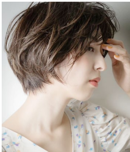
ナチュラルハイライト 9枚

『さらにイメージ通りの仕上がりに近づくような視覚効果を持ったカラー技法で伸びた根元が目立たないのも魅力！』